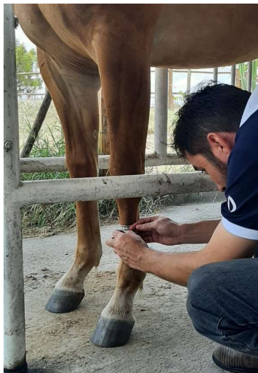
Figura 5: Mensuração do perímetro de canela