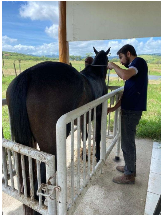
Figura 2: Mensuração da altura à cernelha