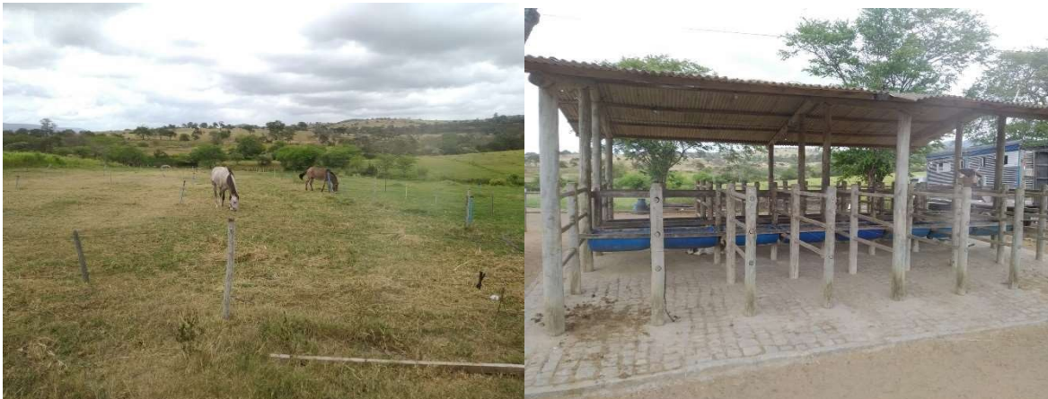
Figura 1: Piquete de éguas e potros lactantes e lanchonete

Todos foram submetidos à avaliação clínica para comprovação de higidez e possibilidade de participar do experimento, de acordo com os parâmetros fisiológicos recomendados por Smith (1994). Todos os animais são criados sob regime semi-intensivo, em pastejo de Tifton 85 rotacionado, com sal mineral e água ad libitum , concentrado (1% a 2% do peso vivo por dia) em cochos individualizados duas vezes ao dia e regularmente vermifugados.