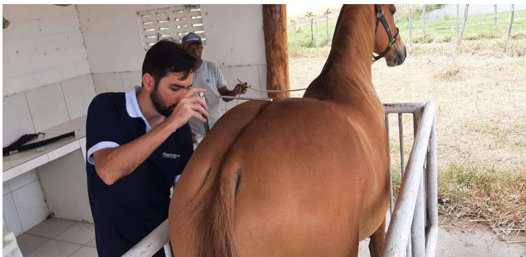
Figura 3: Mensuração da altura à garupa