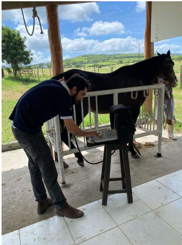
Figura 6: Mensuração da espessura de gordura da garupa

A avaliação da espessura de gordura da garupa (EGG), foram realizadas no nascimento e repetidas a cada 30 dias até completarem 24 meses de vida, através de ultrassonografia, com um transdutor ultrassonográfico linear, em tempo real, de 5,0 MHz. Onde a técnica irá consistir em colocar o transdutor, no ponto médio entre o íleo e o ísquio e a 10,0 cm, lateralmente, da linha média do corpo. A percentagem do tecido adiposo subcutâneo será determinada pela equação: 8,64 + (4,70 \times \text{EGG, em centímetros}) . Uma vez obtida a porcentagem de gordura (PG), a Massa de Gordura (MG) e a Massa Livre de Gordura (MLG) foram calculadas em quilogramas com as seguintes formulas: \text{MG} = \text{Peso} \times \text{PG} e \text{MLG} = \text{Peso} - \text{MG} .